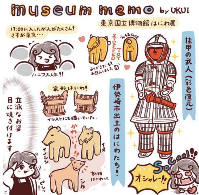
博物館レポート（自主制作、2024年）

完成品をご確認頂き、問題が無ければメールまたはオンラインストレージサービスで納品します。ご希望のファイル形式で納品いたします。納品後請求書を発行し、メールにて送付致します。