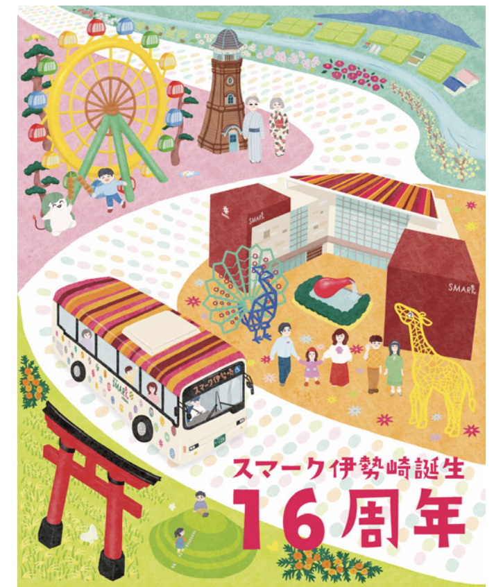
スマーク伊勢崎誕生 16周年記念ビジュアル (2024年)