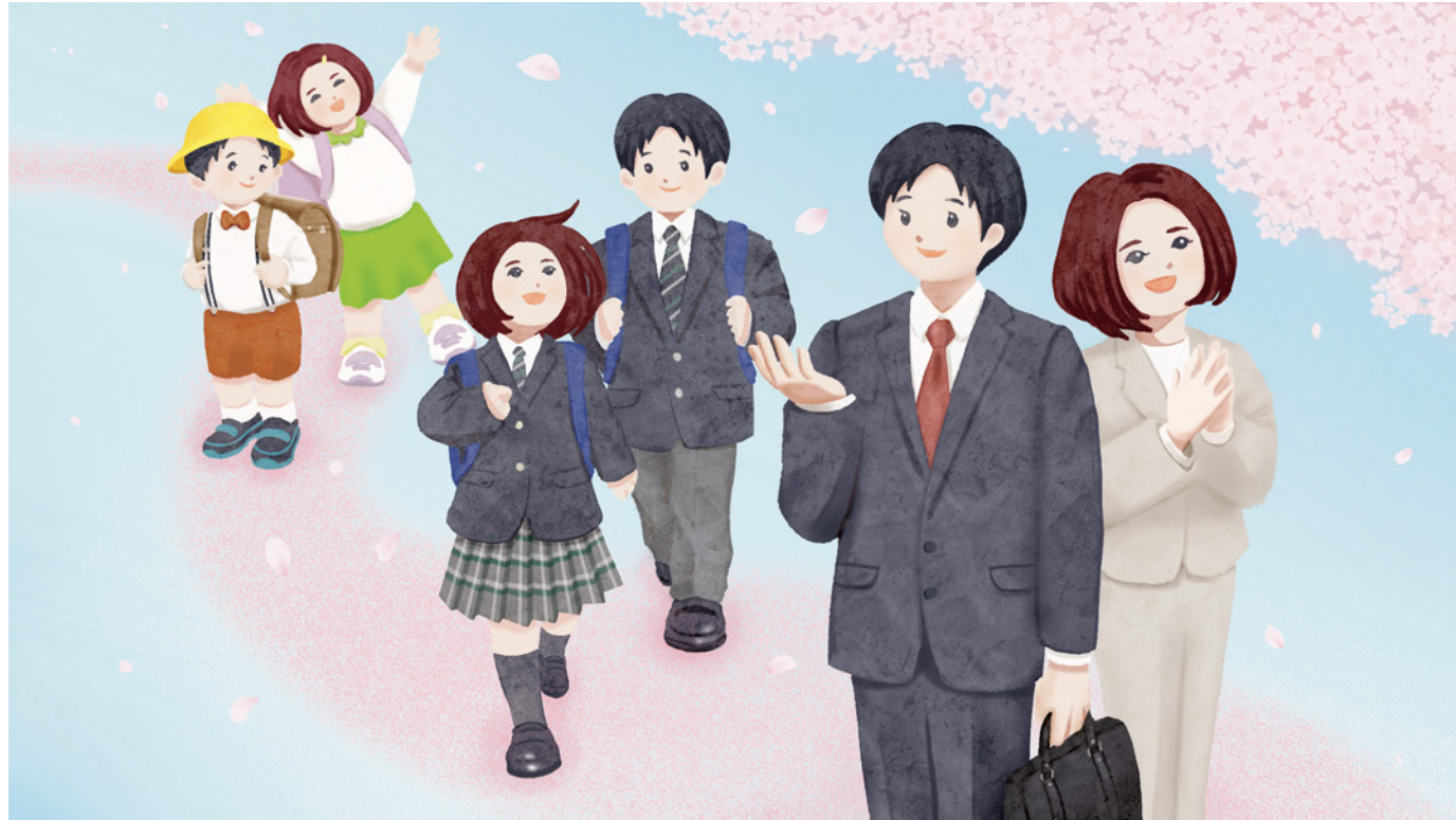
伊勢崎市 ふるさと納税 寄附金使い道事業イラスト (2022年)