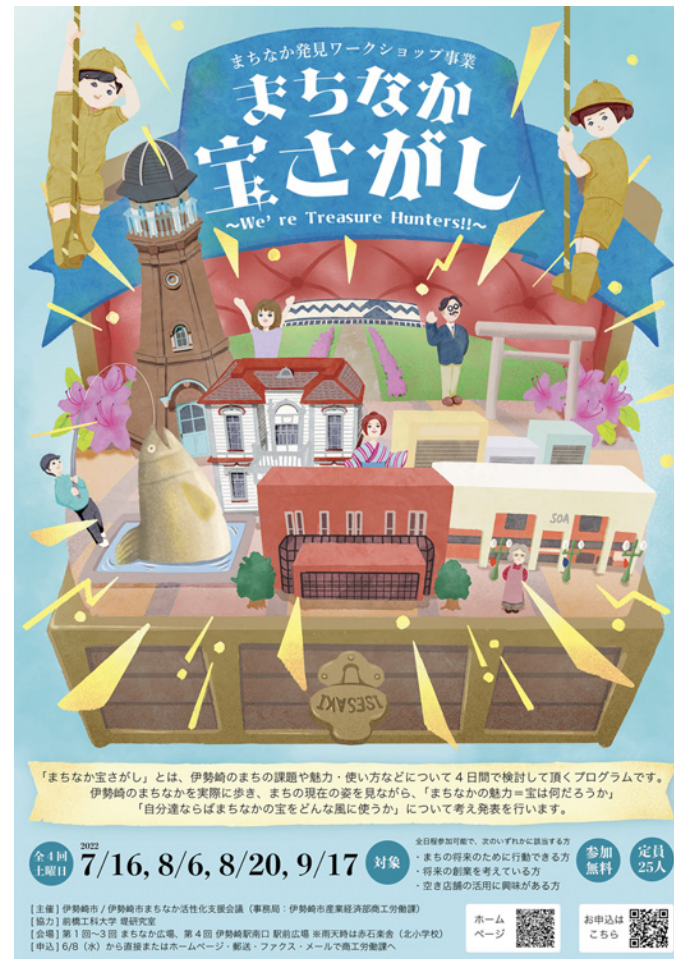
ワークショップ用チラシ (2022年)