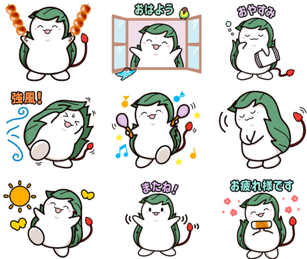
LINE スタンプ くわまる (伊勢崎市 PR キャラクター) (2024 年)