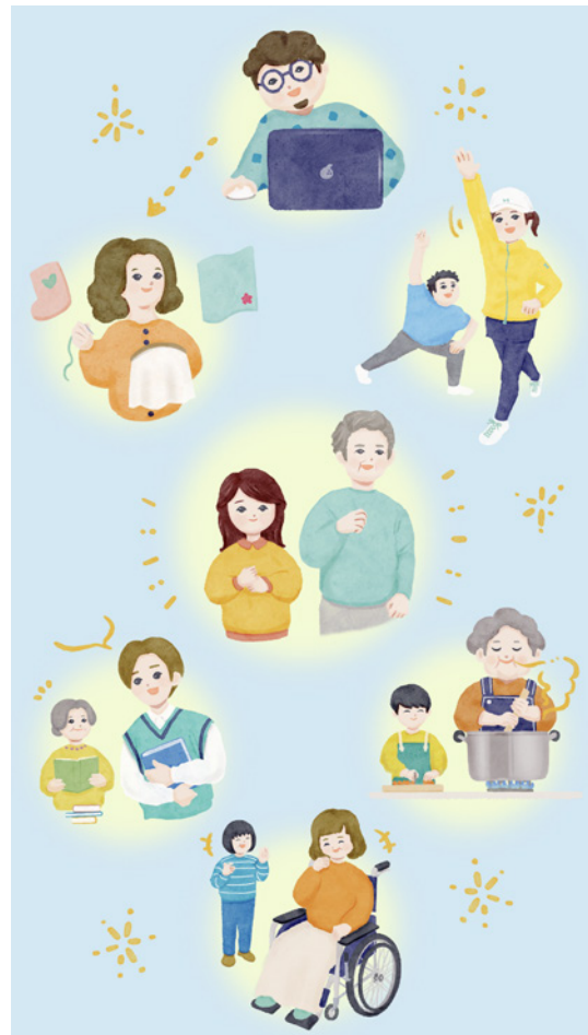
ぐんま脳損傷者地域拠点プロジェクト ウェブサイト用イラスト (2022年)