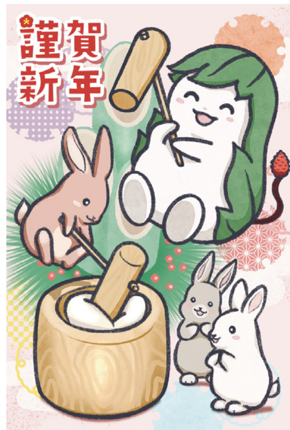
くわまる 卯年年賀状 (2023 年)