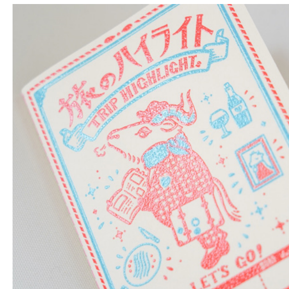
リソグラフ印刷 A6サイズノート（自主制作、2024年）