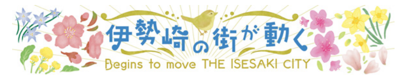
上毛新聞 タイトルイラスト (2022年)