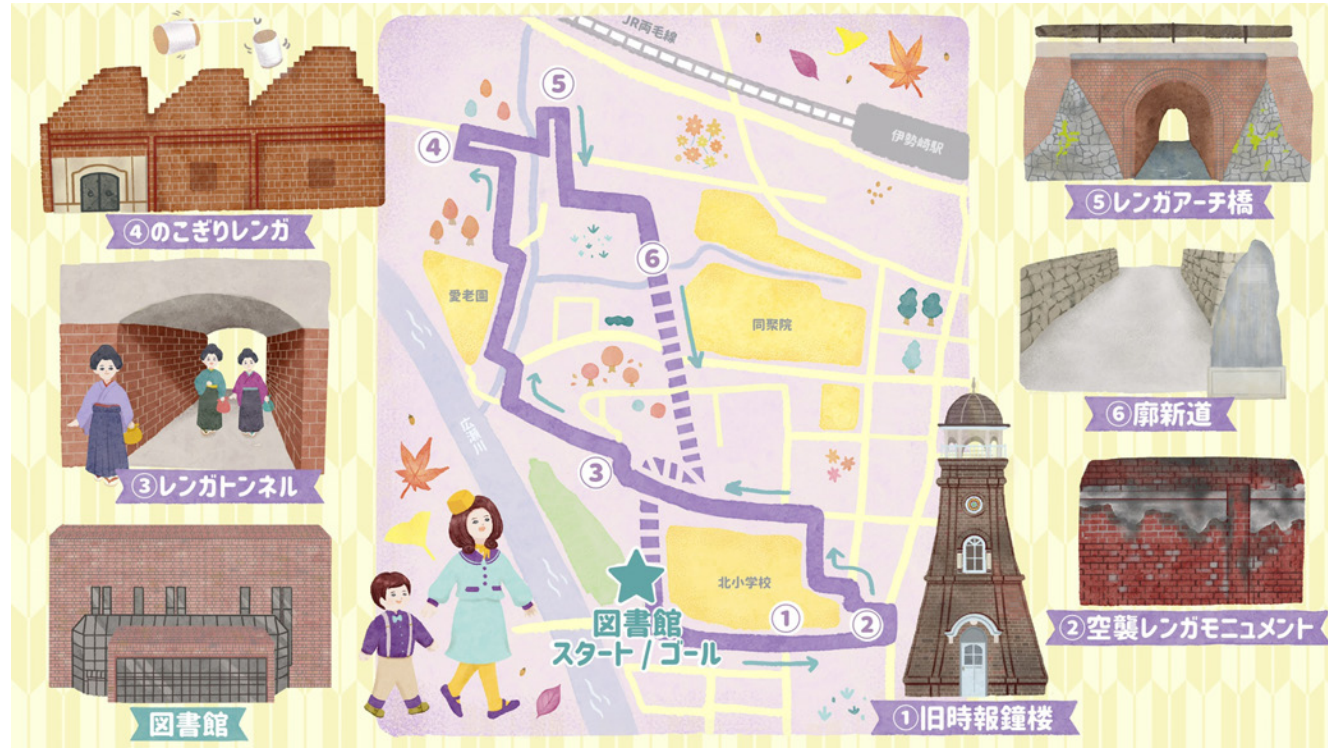
伊勢崎市まちあるき動画用イラスト・キャラクター (2023年)