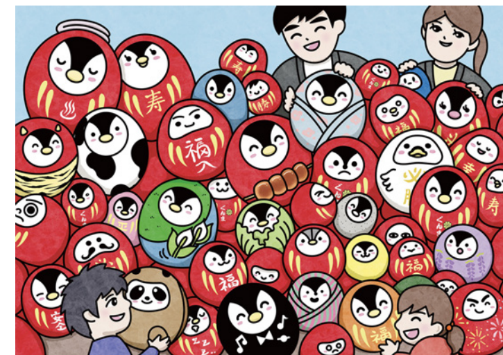
ぐんまミンジー まちがいがさし、めいろ、めりえイラスト (2025 年)