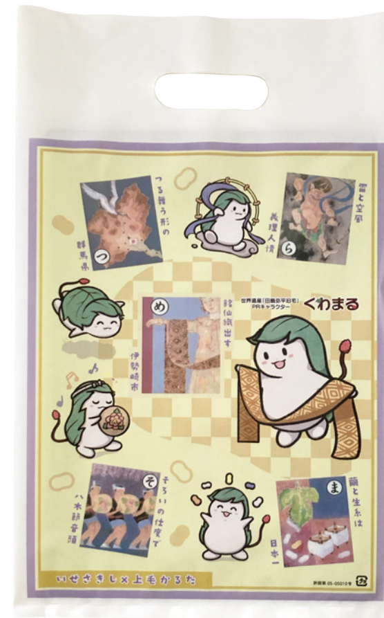
手提げビニール袋 くわまる × 上毛かるた (2023 年)