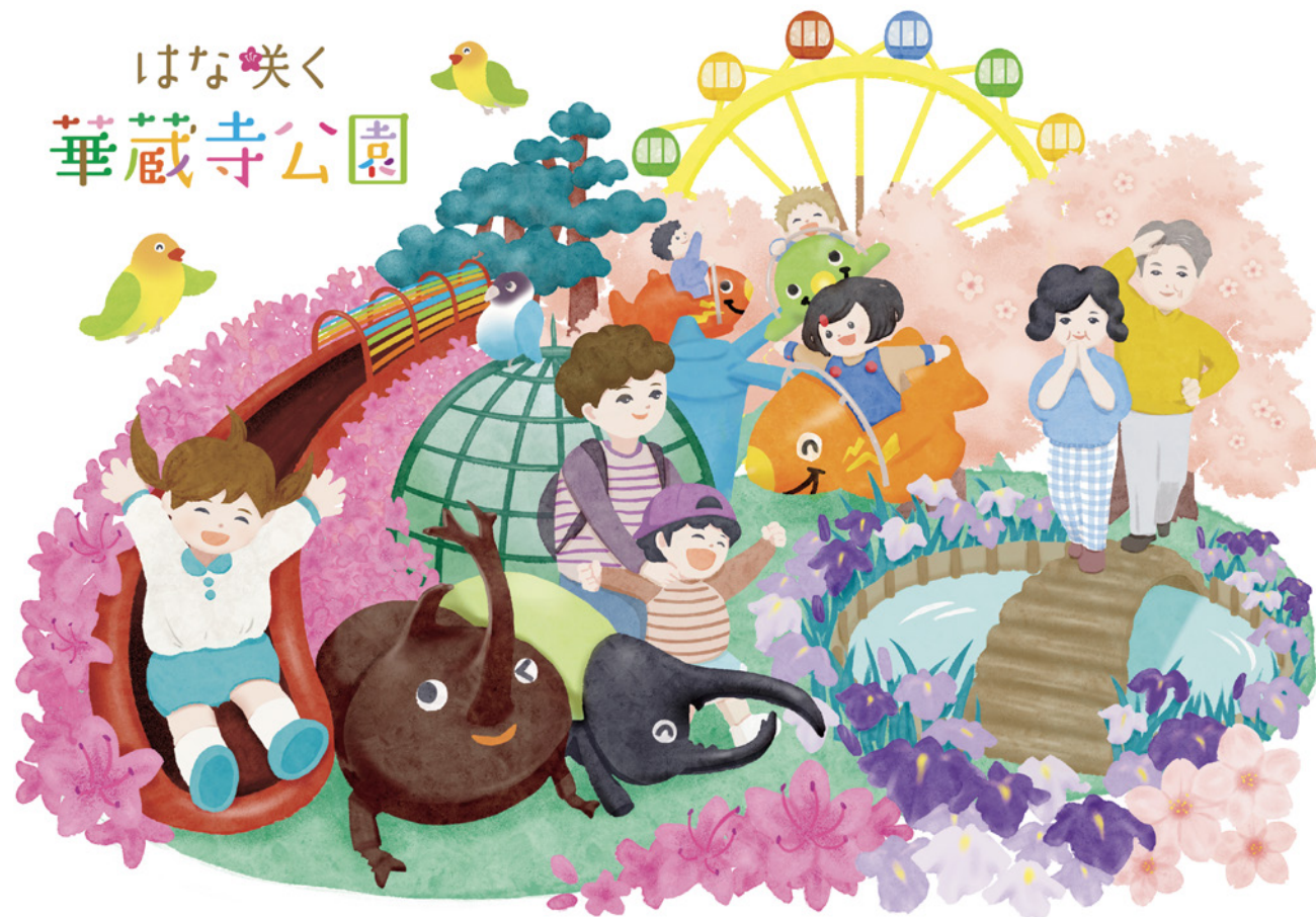
華蔵寺公園 イラスト・ぬりえ (2022年)