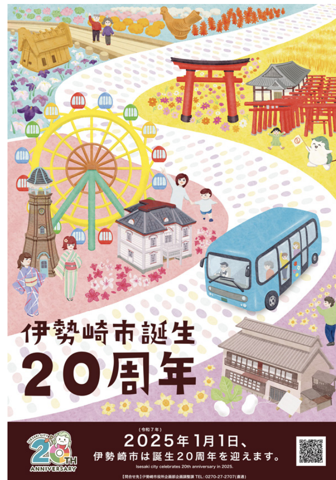
伊勢崎市誕生 20周年記念ポスター (2024年)