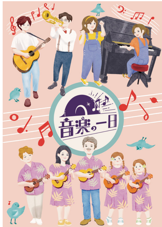
音楽の一日プロジェクト イラスト・ロゴマーク (2022年)