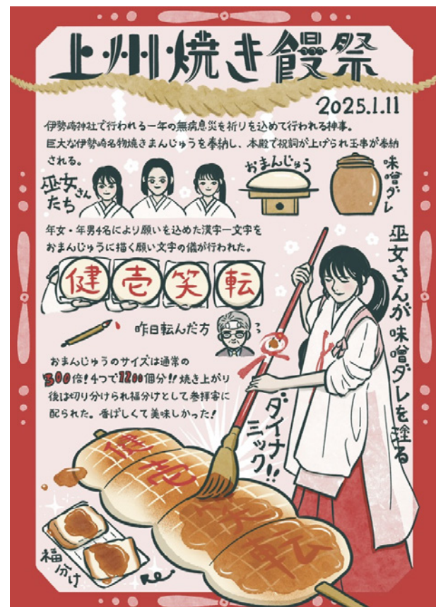
地域祭レポート（自主制作、2025年）