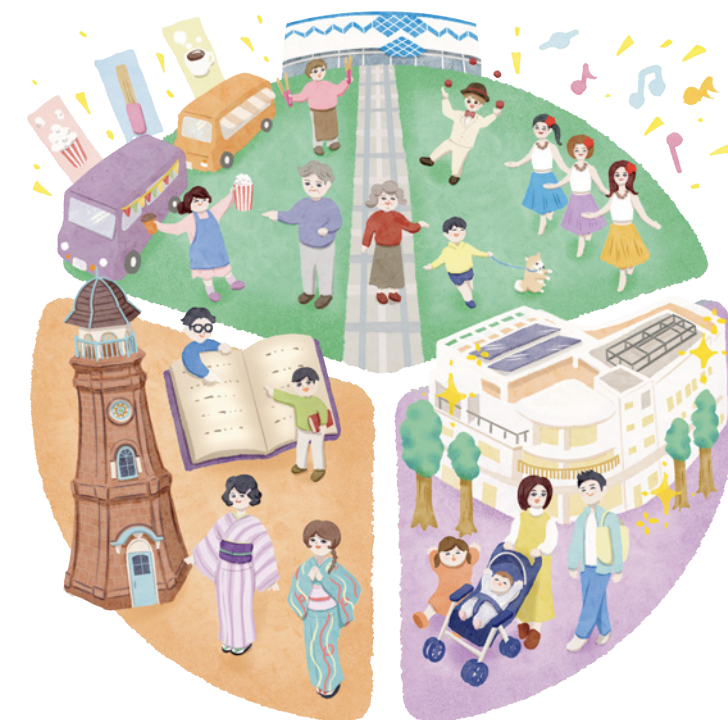
上毛新聞 挿絵イラスト (2024年)