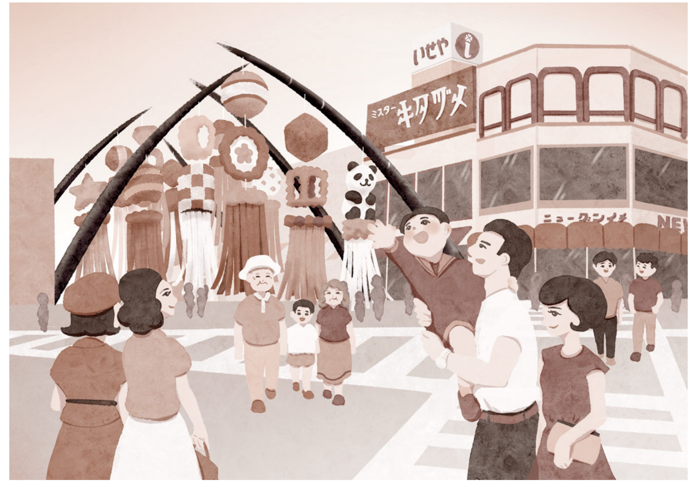
伊勢崎市 パンフレット用挿絵イラスト (2024年)